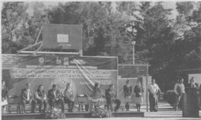
CEREMONIA. En los planteles del Cobaq inició el ciclo 2014-A