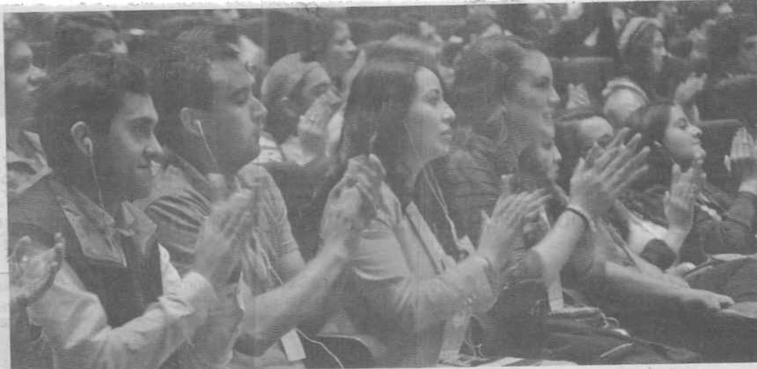
Los jóvenes asistentes estuvieron atentos a la conferencia que dio el famoso doctor 'Patch Adams', dentro del encuentro 'Todo es Posible 2015'

Al asistir a la "Terapia de la Risa", realizada por el reconocido doctor 'Patch Adams', Arely Mayorga, manifestó que todos los